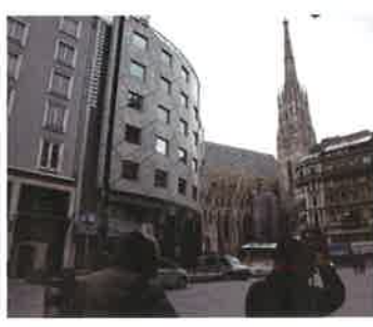
海外ロケ（ウィーン）