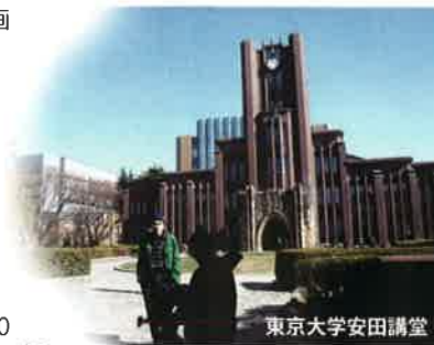
東京大学農田講堂

作品の中に登場する資料には、現存する2冊のみの「私宅監置」報告書（1冊は岡田先生の手元に、もう1冊は国会図書館！）、呉秀三の初めての著作の初版本、家族にあて欧州から送った絵葉書（既に所在不明！）、秘蔵されていた数枚の写真（東大医学図書館に保管）などがある。日本で初公開！呉秀三の欧州留学先での足跡——彼が1900年前後に留学・視察したベルギーとオーストリア（ウィーン大学）に残されている「自筆の署名」を求めて海外ロケを敢行し、彼の下宿アパートもカメラに収めてきた。