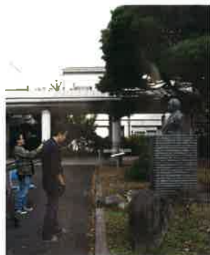
松沢病院の呉秀三胸像

呉秀三（くれしゅうそう）は、今から百年前の時代に東京大学医学部精神科の教授として、異例の社会的な取組みを進めた先達者である。彼は精神疾患の人々が「座敷牢」に押し込まれる実情を憂い、その解決のために奔走した。その土台となった報告書『精神病人私宅監置ノ実況及び其統計的観察』を1918年に提起し、多方面へ働きかけた。それから1世紀の年月が過ぎた今、精神障害者の問題はどのようなのだろうか？